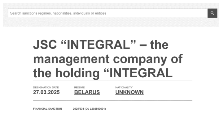
Rysunek 3. Przykładowy wynik wyszukiwania dla frazy „JSC Integral” wytwarzającej układy scalone.

satelitarnej, cyfrowe systemy uwierzytelniania i podpisu, a także tokeny i algorytmy kryptograficzne) oraz 6 (czujniki i lasery, wzmacniacze obrazu i dźwięku) 93 .