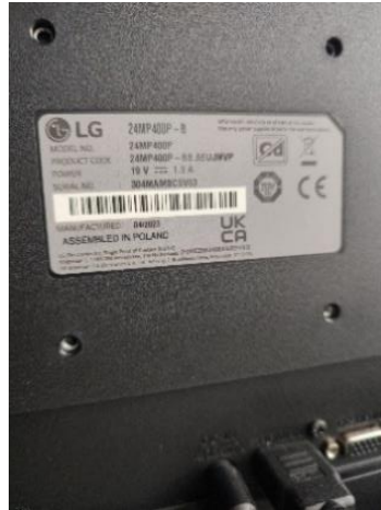
Rysunek 2. Tabliczka znamionowa monitora LG zmontowanego w Polsce.